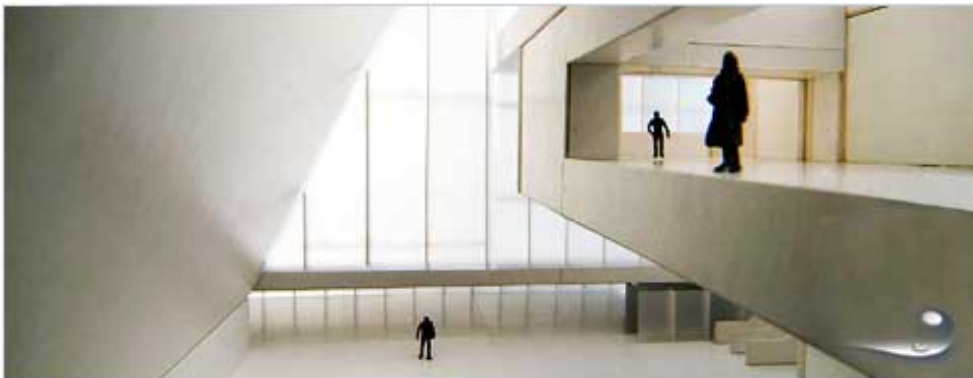
Render del interior del Auditorio