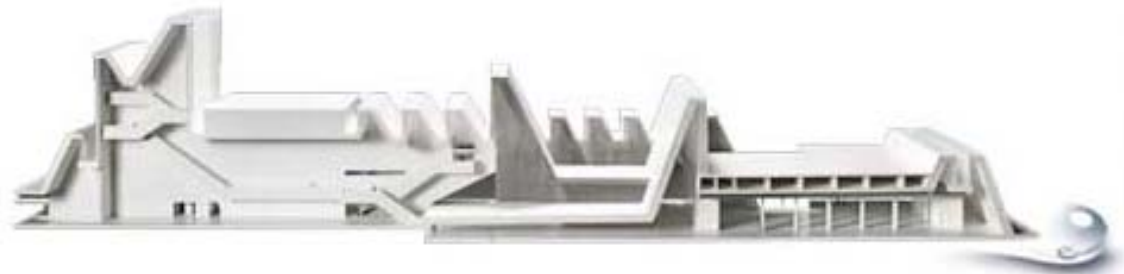
Render del exterior del Auditorio

A) El Palacio de Congresos realizado por los Arquitectos Fuensanta Nieto y Enrique Sobejano de Madrid. La cerámica de gres de alta temperatura se ha utilizado para realizar toda la cubierta de este Palacio de Congresos con, placas de GRC de 1,80 x 8,50 metros. Las piezas son de forma geométrica de 21x42 cm en acabado blanco brillo y blanco mate que a su vez forman rombos compuesta por ocho triángulos cada uno. Las placas de GRC tienen en cada una de ellas 24 rombos mezclados con cerámica blanco brillo y blanco mate que dan a la cubierta una reflexión de luz solar con efectos cambiantes. La cubierta está formada por 8.500 metros y 15.000 rombos cerámicos.