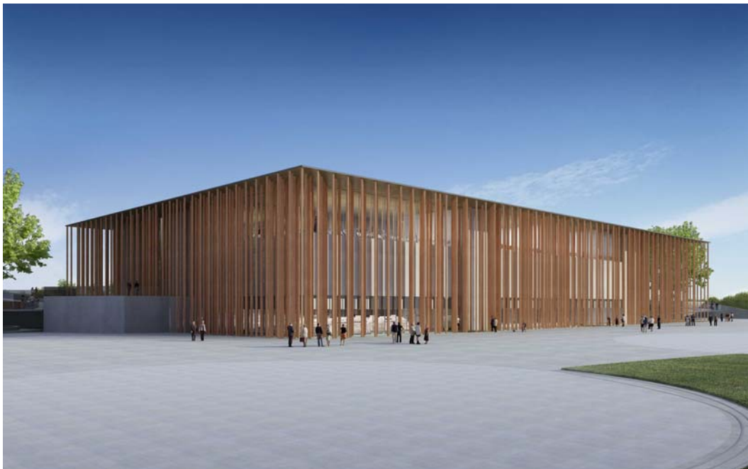
Render del exterior del Pabellón

Para ello Patxi Mangado a diseñado 750 pilares de hierro de 16 metros de altura y dos secciones de 25 cm y 15 cm de diámetro. Estos pilares están recubiertos por unas piezas semicirculares de 90 cm de altura por 30 cm de diámetro que van ancladas alrededor de los pilares y forman 750 columnas de barro cocido, material cerámico tradicional en la Arquitectura de Aragón y que a su vez permite una circulación y evaporación del agua que creara un micro – clima a la dinámica ambiental en dicho pabellón.